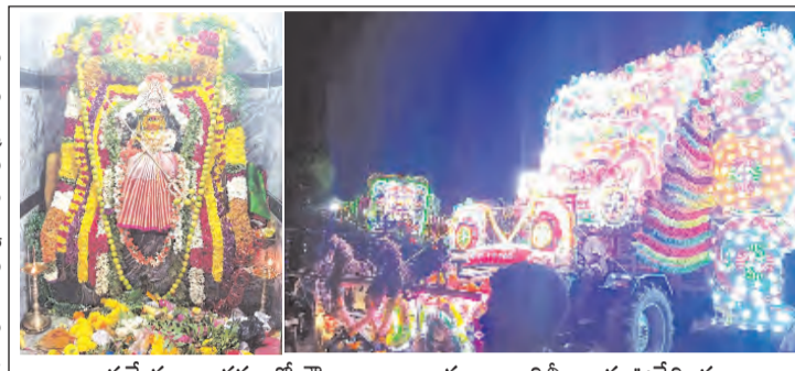
ప్రత్యేక అలంకరణలో రౌద్రాల అంకాలమ్మ, వాందినీ బండ్లు ఊరేగింపు