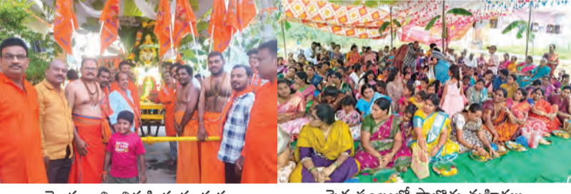
గ్రామోత్సవాన్ని నిర్వహిస్తున్న దృశ్యం పెద్ద సంఖ్యలో పాల్గొన్న మహిళలు.

నందలూరు, మే 12 ప్రభాతవార్త : గ్రామంలోని నాగిరెడ్డిపల్లి మేజర్ గ్రామంపంచాయతీ పరిధిలోని ఆరవపల్లి గ్రామం లుంగటూరు ప్రకాశం వీధి, గాంధీనగర్, గొల్లపల్లి లోక్లలో వెలసిన శ్రీ ప్రసన్న వర్ధాంజనేయ స్వామి దేవాలయాలలో మంగళవారం హనుమంతుని వేడుకలను భక్తిశ్రద్ధలతో ఘనంగా నిర్వహించారు. ఈ సందర్భంగా స్వామివారికి పంచామృతాభిషేకం, గణపతి పూజ, కుంకుమార్చన, ఆకు పూజ, శ్రీ హనుమత్ ప్రతీక నిర్వహించారు. ఆనంతరం భక్తులకు తీర్చడం సాధించి పంపిణీ చేశారు. మధ్యాహ్నం భారీ అన్నదాన కార్యక్రమం చేపట్టగా భక్తులు పెద్ద సంఖ్యలో పాల్గొన్నారు. సాయంత్రం మేళాతాళం