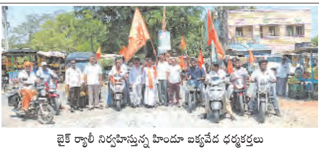
బైక్ ర్యాలీ నిర్వహిస్తున్న హిందూ ఇక్యవేద ధర్మకర్తలు